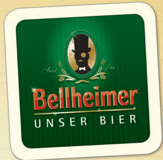
Vorderseite: moderne Optik

D as Gute zu bewahren und sich trotzdem mit Augenmaß zielstrebig weiterzuentwickeln, ist die Philosophie der Bellheimer Brauerei. Denn „Tradition und Moderne“ sind kein Widerspruch, sie passen ausgezeichnet zusammen. Das unterstreichen auch die neuen alten Bellheimer Bierdeckel, die demnächst in der Gastronomie ausliegen. Auf der einen Seite sieht man das aktuelle Logo der Brauerei und den Lord als Zeichen der hohen Qualitätsansprüche, auf der Rückseite warten vier historische Bierdeckelmotive aus der Geschichte der Bellheimer Brauerei darauf, entdeckt zu werden. Gehen Sie mit uns auf Zeitreise und sammeln Sie mit!